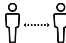
人と人との距離の確保