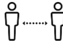
人と人との 距離の確保