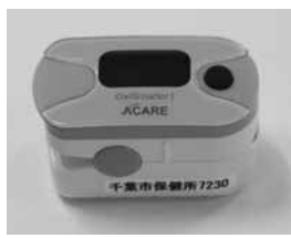
パルスオキシメータ

返却方法 パルスオキシメータに同封の返却用封筒で返却してください。返却用封筒を紛失した方は、〒261-8755千葉県保健所感染症対策課へ郵送するか、直接持参してください。