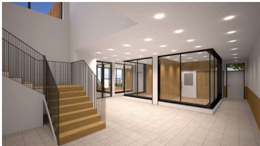
エントランスホールイメージ (社会化室、ふれあい室)