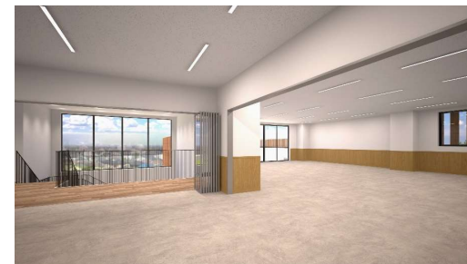
ホワイエ、多目的ホールイメージ