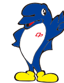
千葉県警察 シンボルマスコット 「シーボック」