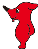
千葉県マスコット キャラクター 「チーバくん」

健康福祉部 薬務課ホームページ http://www.pref.chiba.lg.jp/yakumu/index.html