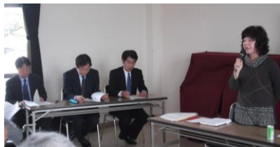
納元部会長のあいさつ

住民の思いを形にした、住民自身による地域福祉活動です。サービスを利用する人も、提供する人も同じ地域に住む住民同士。この活動により、地域の福祉力を掘り起こし、「ここでずっと暮らしたい！」と思えるまちづくりをめざします。