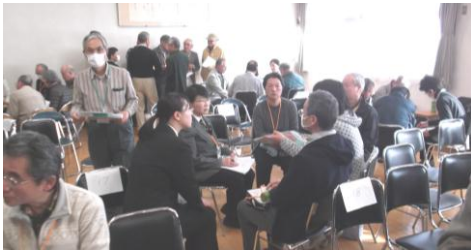
発足式後の各担当地区打合せ

・松ヶ丘地区部会では、平成 27 年 4 月からの見守り活動の開始に向け、取り組んでまいりました。地区部会役員・民生委員・町内自治会役員等からなる“見守り作業部会”を立ち上げ、体制づくりの検討を重ね、平成 27 年 3 月 22 日に発足式を迎えることができました。