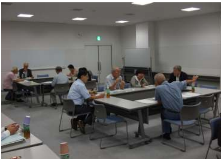
平成21年度第2回推進協の様子

今後、この地域福祉計画を推進していくためには、当計画が現状に即しているのか、検討して見直しを進めることが必要です。美浜区推進協議会では、この計画の再検討と見直しを進めるにあたっては、施策の方向性ごとに3つのグループを設置し、この第2回会議から、委員がグループに分かれ話し合いが行われました。