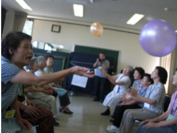
風船バレーで元気いっぱい！

「ふれあい・いきいきサロン」とは、高齢者とボランティア等の地域住民が気軽に集い、ふれあいを通して生きがいがづくり・仲間づくりの輪を広げる事や、介護予防が期待できる活動です。