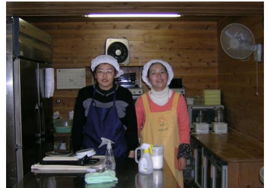
【焼きたて、手づくりパンはいかがですか？】

その様な事を考えながらも、テレビや新聞などで目にする震災から来る次から次への被害に苦しむ人達を思うと、もっと、もっと、日々の小さな幸せを、自分の物として感じて、生きる力にしていきたいです。これからも、作業所福祉ショップひびきに通いたいです。