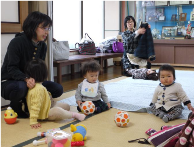
みんなで遊ぶと楽しいね！

「ふれあい・子育てサロン」とは、子育て中の親子が気軽に参加し、自由に遊んだり、おしゃべりや情報交換をしたり、子育てを楽しみながら仲間をつくり、互いにささえあう活動です。