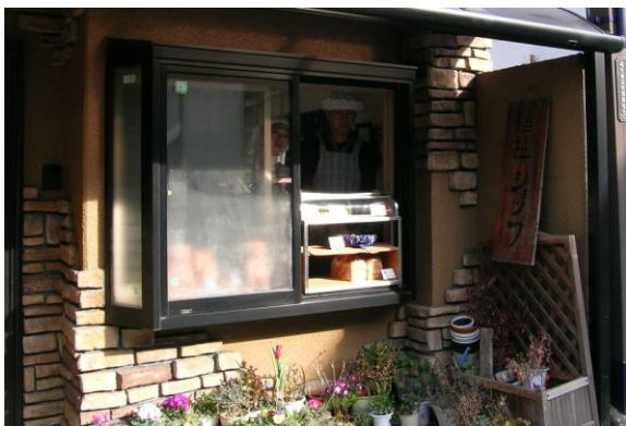
【福祉ショップひびき店頭風景】

〒263-0031 稲毛区稲毛東 2-16-33 TEL & FAX 043-242-5453 (浅間通り 京成稲毛駅そば)