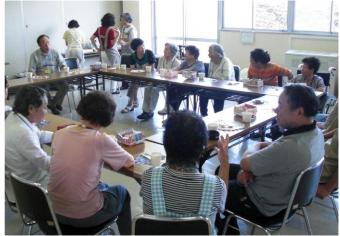
お茶とお菓子で話も弾みます！