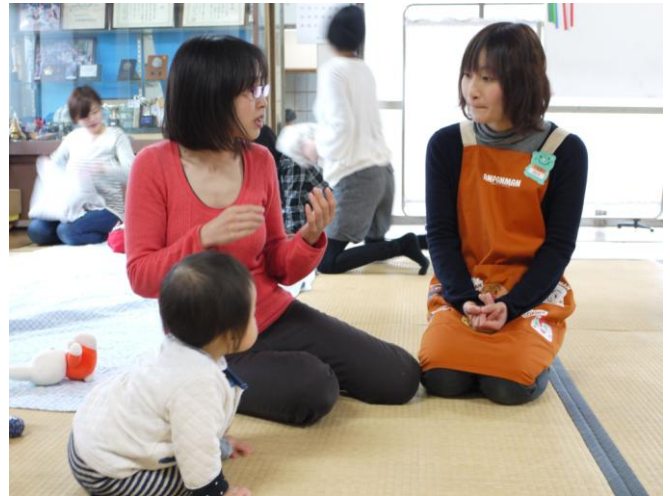
ママと一緒に相談タイム！