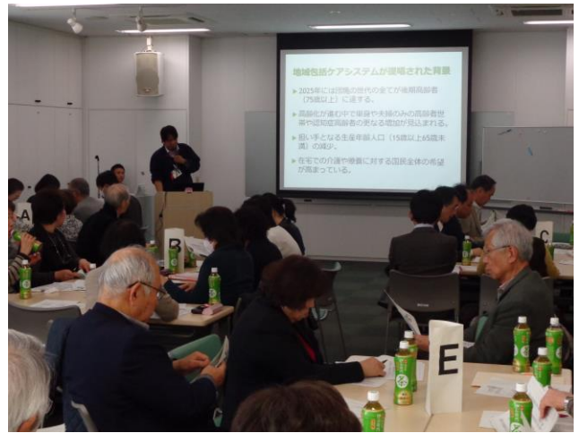
様々な分野の参加者がグループごとに話し合う企画

これからの地域社会、地域福祉を考えるうえで、こうした場の重要性・有用性を認識する会議でした。