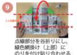
点線部分を谷折りにし、緑色網掛け（上部）にのりを付け貼り合わせる