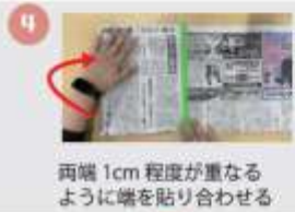
両端 1cm 程度が重なるように端を貼り合わせる