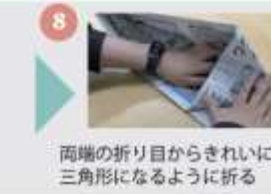
両端の折り目からきれいに三角形になるように折る