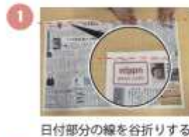
日付部分の線を谷折りする