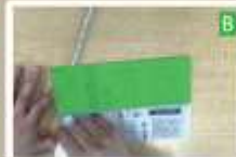
B を横位置で半分に折り、A を挟んで緑色網掛け部分をのり付けし貼り合わせる（同様にもう 1 つ作る）