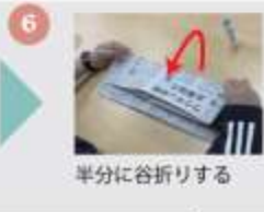
半分に谷折りする