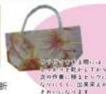
この袋で折る際には、必ず折り目と緑色網掛け部分の位置を合わせてください。出来栄がきれいになります。