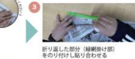
折り返した部分（緑網掛け部）をのり付けし貼り合わせる