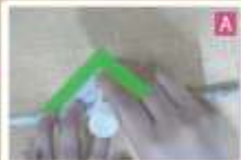
くるくる巻き、最後の三角形の緑色網掛け部分にのりを付け、そのまま巻き切る（同様にもう 1 本作る）