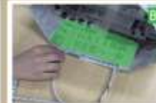
本体内側の中央に位置を合わせ、緑より 1.5cm 程下にならずに貼り付ける（反対側も同様）