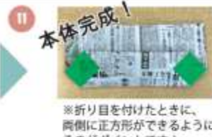
※折り目を付けたときに、両側に正方形ができるように折るのがポイントです！