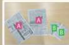
開いた新聞紙 1/4 (A) と、それを更に 1/4 したもの (B) を各 2 枚用意する