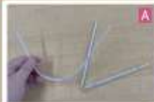
巻き切った棒を真ん中で折り、指を使ってきれいなカーブを作る