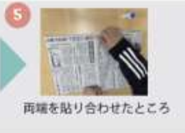
両端を貼り合わせたところ