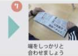
端をしっかりと合わせましょう