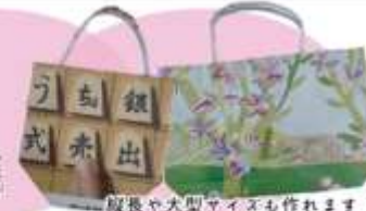
縦長や大型サイズも作れます！