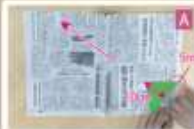
A の端を高さ 10 cm の三角形ができるように折り、更に芯になる 5mm ほどを折り返す