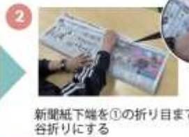
新聞紙下端を①の折り目まで谷折りにする