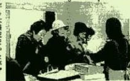
今年も大盛況だったバザー