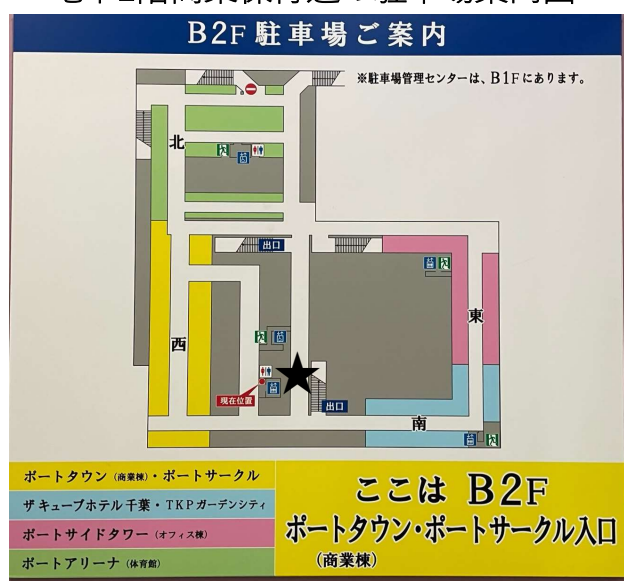
地下2階商業棟付近の駐車場案内図

上記「★」印の入り口から入り、2階で連絡通路を通してポートサイドタワー側に移動してください。ポートサイドタワーのエレベーターは1階、2階で乗る場合「B1-16F」と「1・2・6・16-28F」の2種類があります。当センターにお越しになる際は柱の表示をご確認の上「B1-16F」にお乗りください。