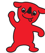
千葉県PRマスコットキャラクター チーバくん