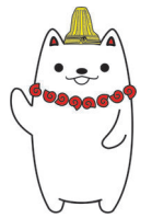
加曾利貝塚PR大使 かそりーめ

11:30 認知症短編映画 「日々はつづいていく」 11:30~12:10 (受付:11:15~) (事前予約なし先着50名)