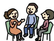
高齢者の身近な 相談機関