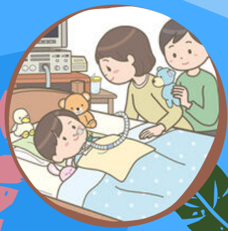
🌸 小児看護 🌸