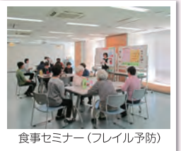
食事セミナー(フレイル予防)