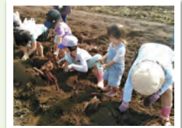
サツマイモ等野菜の収穫体験