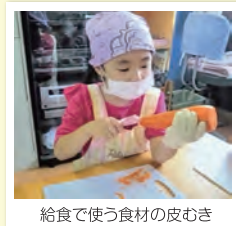
給食で使う食材の皮むき