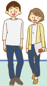
青年期・壮年期 (20~64歳)