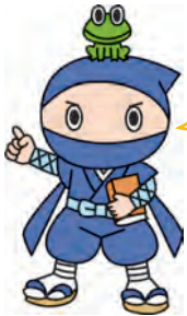
あくしつしょうほう 悪質商法ひっかからん蔵

ものを買ったり使ったり、 のりものに乗ったり、習い事をしたり。 みんな「消費」なんだよ！