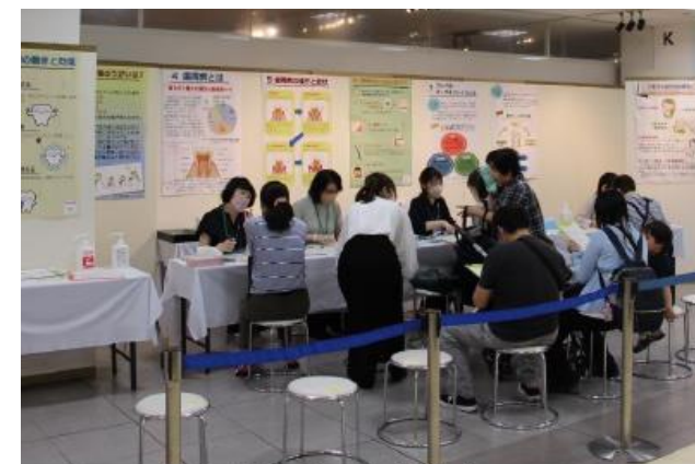
バタカ測定でお口の健康度チェック