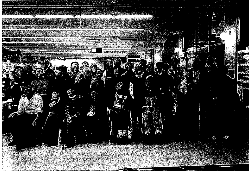
第六十七回 ふれあいポウリング大会 (JFE千葉リバーレーンにて)