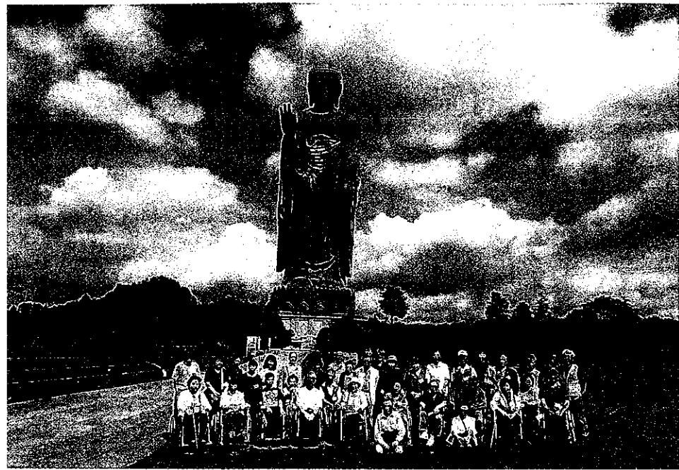
平成27年度重度慰安旅行「牛久大仏」前にて