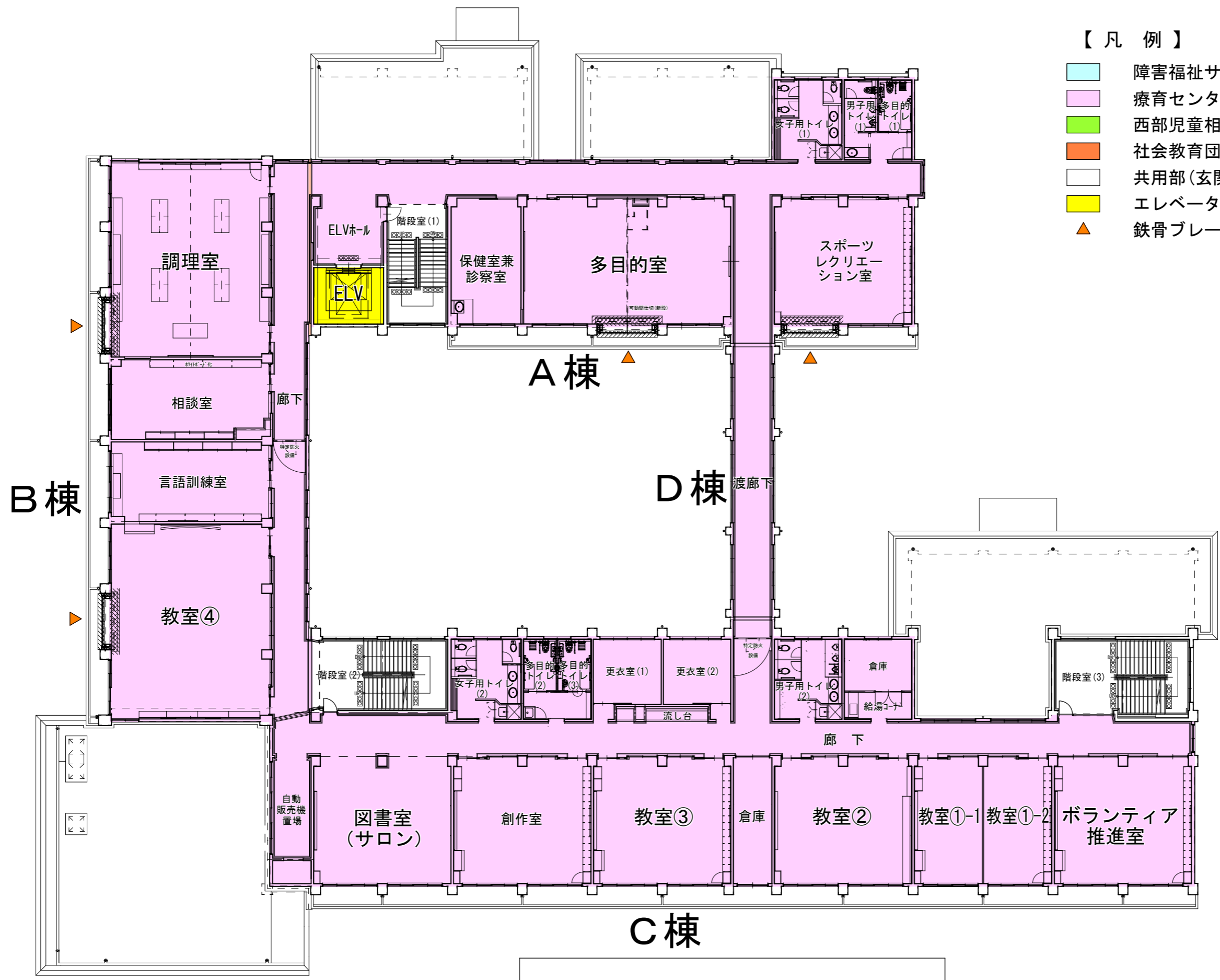
2 階 平 面 図