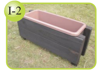
I-2 横50×縦17×高さ21cm。 プランターカバー…500円