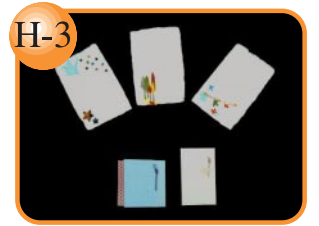
H-3 オリジナルのデザイン。 手漉きポチ袋のし袋50円