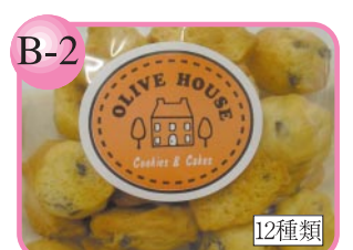
B-2 国産小麦使用12種類の味あり。 クッキー…200円