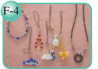
F-4 天然石使用もあります。 ビーズアクセサリー300円