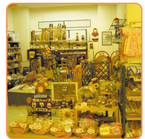
全国の施設製品を販売。 ◆福祉ショップ◆ けやき 〒263-0005 千葉市稲毛区長沼町330-50 TEL/FAX.043-286-0778