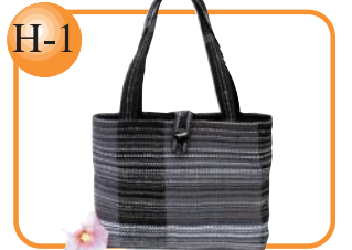
H-1 お好みの色や大きさで作ります。 機織りバッグ(特大)5,000円