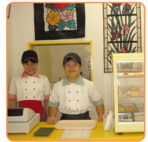
ランチなど店内で召し上がれます。 ◆パイショップ◆ PAL稲毛アービョーヨー 〒263-0051 千葉市稲毛区園生町449-1-3 TEL/FAX.043-206-1340