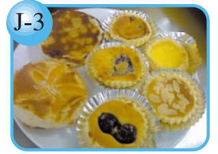
J-3 アプリコット、アップルなど。 スイーツパイ…120円