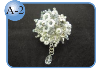
A-2 チェコビーズ使用。 アンティークブローチ1,500円