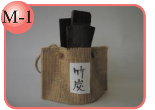
M-1 記念品や贈り物にも。 竹炭…400円