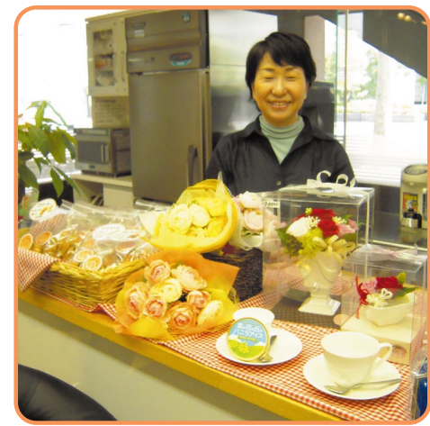
おいしいコーヒーを提供。 ◆喫茶◆ 秋桜(千葉市民会館内) 〒260-0017 千葉市中央区要町1-1 TEL/FAX.043-201-1190