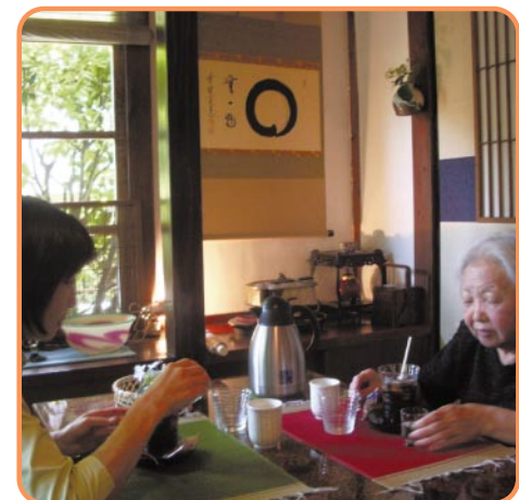
和食中心の家庭料理と甘味処。 ◆食堂◆ キッチン圓MARU 〒263-0021 千葉市稲毛区轟町1-2-6 TEL/FAX.043-290-0051