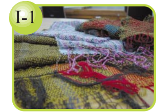
I-1 お好みの色で手織りで作ります。 ショール…1,000円