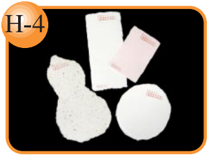
H-4 ひょうたんや丸のはがきなど。 手漉きはがき…50円