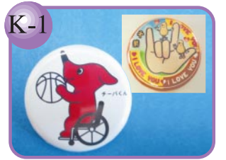
K-1 千葉限定 I♡YOU バッジ。 缶バッジ…150円