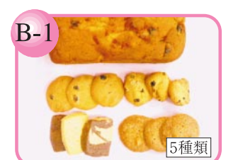
B-1 手作り。5種類の味あり。 パウンドケーキ…500円