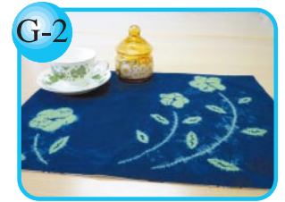
G-2 大和藍を使用。 藍染ランチョンマット800円