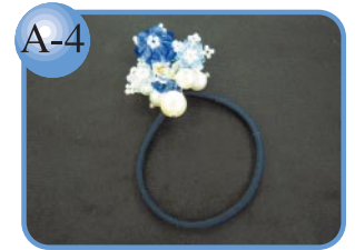
A-4 スワロフスキー使用高級ヘアゴム。 ヘアゴム…3,000円