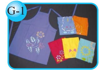
G-1 デザインは豊富です。 型染エプロン…1,500円