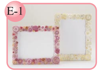
E-1 「輪」をモチーフにしました。 ビーズフレーム「輪」3,500円