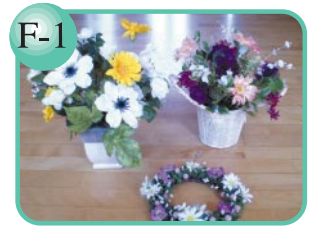
F-1 お好みでご注文も承ります。 ドライフラワーアレンジメント300円