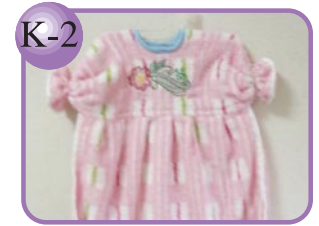
K-2 刺しゅう入りドレス型タオル。 ドレスタオル…500円