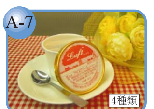
A-7 千葉産の牛乳を使用。 ルフト ストロベリー200円