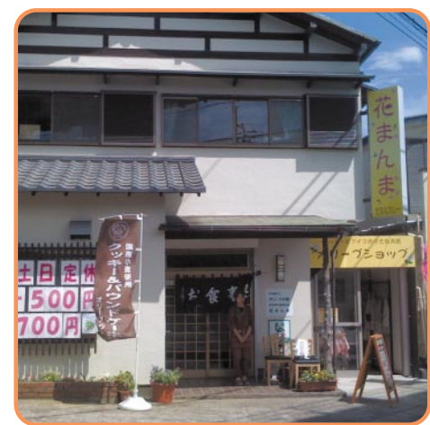
昭和レトロの食堂。 ◆食堂◆ 花まんま 〒263-0024 千葉市稲毛区穴川3-11-22 TEL/FAX.043-239-6083