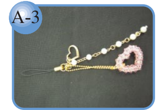
A-3 スワロフスキー使用。 ハートのストラップ2,000円