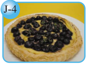
J-4 ホームパーティにぴったり。 ホールパイ(18cm)1,300円