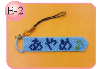
E-2 文字や絵柄を選べます。 手作りビーズストラップ500円