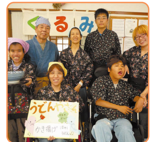
心もからだも温まります。 ◆うどん◆ くるみ 〒261-0012 千葉市美浜区磯辺1-9-19 TEL/FAX.043-270-1588