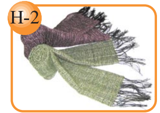
H-2 季節に合わせて作ります。 機織りショール 1,500円