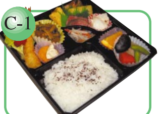
C-1 会議弁当各種あります。 はつらつ弁当…700円