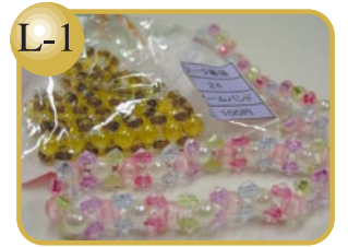
L-1 ビーズで作りました。 アームバンド(ビーズ)100円