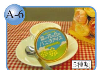
A-6 千葉市観光推奨品。 季節のアイス菜の花の丘パニラアイス5種類 250円