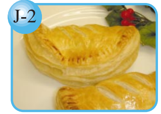
J-2 チキン、ミート、白身魚など。 お惣菜パイ…180円