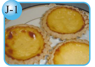
J-1 さわやかな甘さで軽い口どけ。 エッグタルト…80円