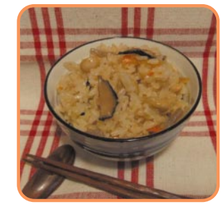
D-1 2〜3合炊き(200グラム) 五目ごはんの素…250円