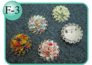
F-3 木綿のハンカチから作りました。 手作りブローチ…650円