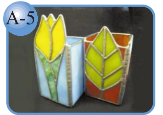
A-5 一品ずつ手作り。 スタンドペン立て1,500円