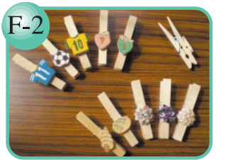
F-2 マグネットがついています。 ウッドクリップ…400円