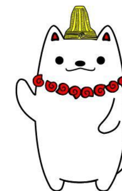
加曾利貝塚PR大使 かそりーぬ