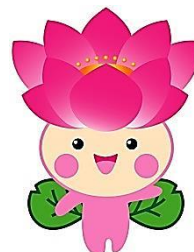
「花のあふれるまちづくり」 シンボルキャラクター ちはなちゃん

身体障害者福祉法第11条に基づく「身体障害者更生相談所」と知的障害者福祉法第12条に基づく「知的障害者更生相談所」の両機能を併せ持った施設です。 18歳以上の、身体障害者、知的障害者及びその家族からの専門的な知識や技術を必要とする相談に応じ、その福祉の向上を図ることを目的としています。