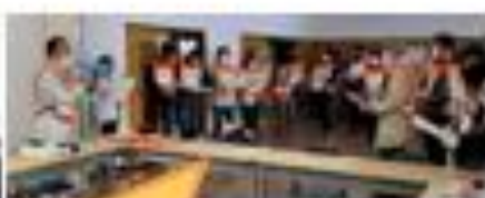
8:00 運営員 穴川集会所 集合