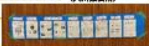
簡易トイレについて 体験・説明