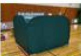
ワンタッチパーテーション (ファミリールーム)体験