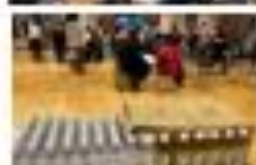
10:15 食糧班から保存食の説明・参加賞(アルファ米など)の配布