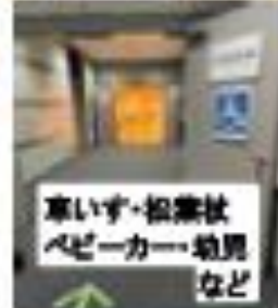
車いす・松葉杖 ベビーカー・幼児 など