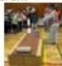
段ポールベットの 組立訓練・使用体験