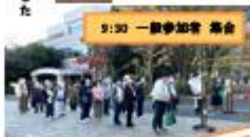
9:30 一般参加者 集合