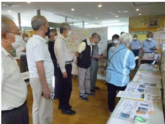
本部 事前に設営していた本部の様子 作成方法の一例です。避難施設の環境に見合った案内・BOXの設置をお願いします。