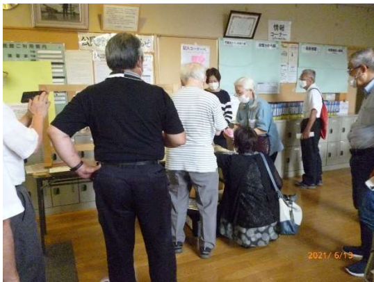
2次受付 受付用紙などの設置