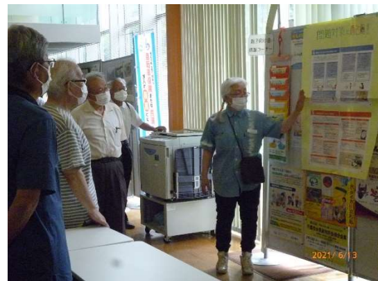
本部 本部掲示物の説明