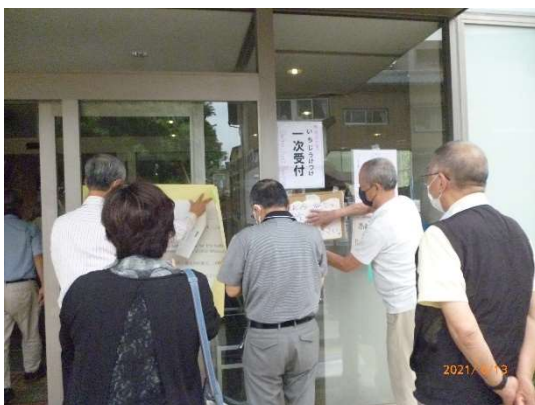
1次受付 案内表示の貼り付け