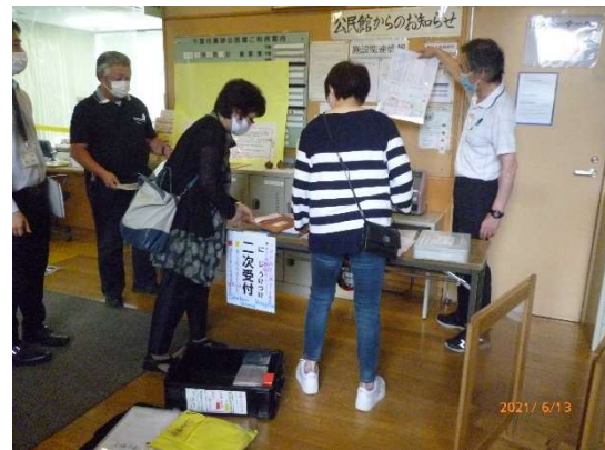
2次受付 案内表示の貼り付け