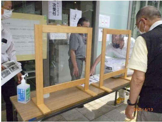
1次受付 飛沫防止板設置