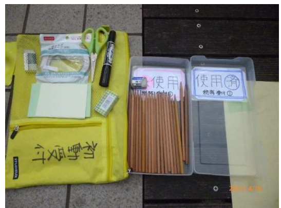
事務用品も一括で保管せず、個別に