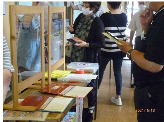
2次受付 設置完了状況の確認