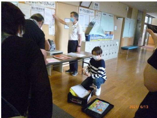
2次受付 BOXから取り出し