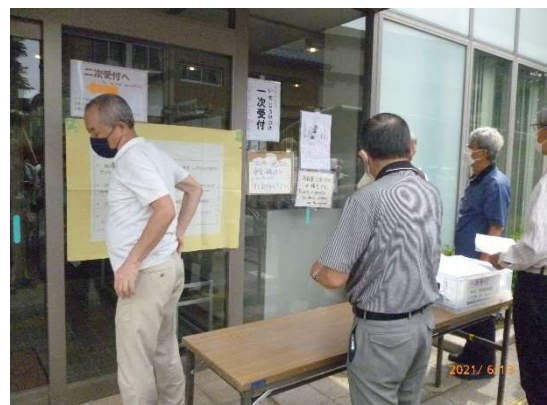
一次受付 受付テーブル設置