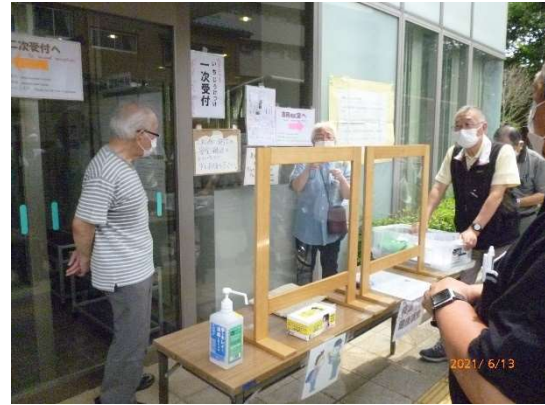
1次受付 設置完了状況の確認