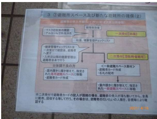
運営フローも見やすく作成