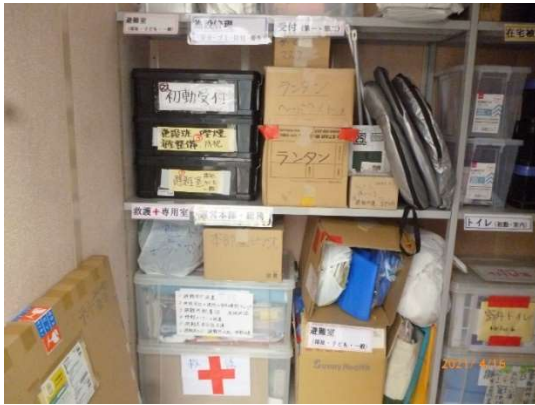
保管庫内（見やすく表示されています）