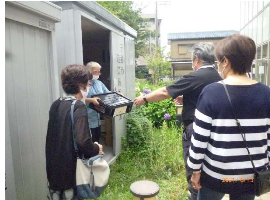
搬出（女性でも持ち運べます）