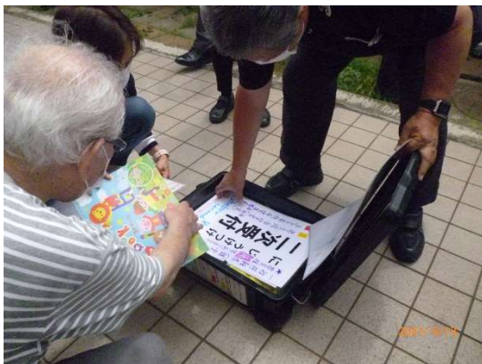
蓋を開ける（中身の確認）