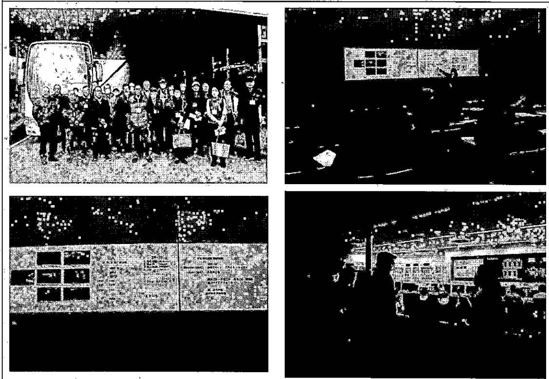
新港クリーン・エネルギーセンターでの様子