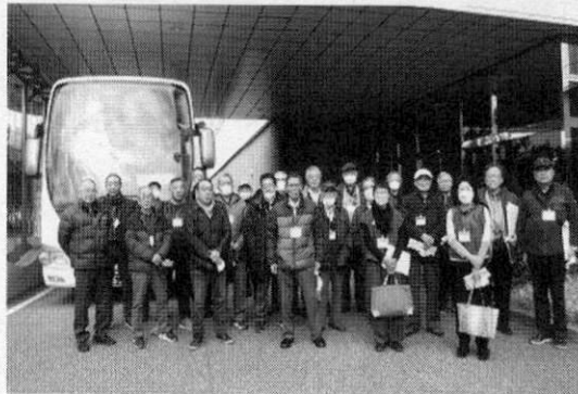
新港クリーン・エネルギーセンターでの様子