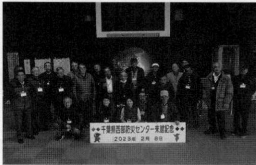
千葉県西部防災センターでの様子

訓練用人体模型を使った心肺蘇生など、災害時の応急救護の方法を知識だけでなく体験的に学ぶことができる。