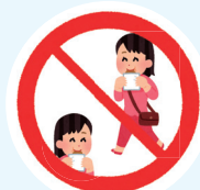
食べ歩きは禁止 (飲食は決められた場所です)