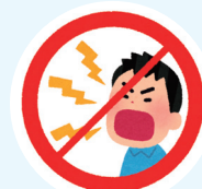
会場内での大声禁止