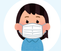
飲食時以外マスク着用