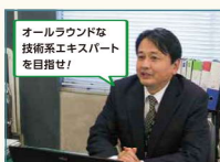
オールラウンドな技術系エンジニアを目指せ!