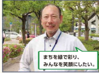
まちを緑で彩り、みんなを笑顔にしたい。