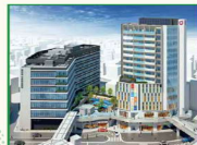
完成イメージパース （左から病院棟、公館棟、商業棟）

千葉駅西部では、JR千葉駅の駅舎・駅ビルの建替えや西口・東口地区の再開発事業など、次々と都市機能の刷新が行われています。その中で西口地区の再開発事業は、平成2年に事業計画が決定され、平成25年には複数の飲食店やコンビニエンスストア、ホテル等が入居する3棟の複合ビル「ウェストリオ」を完成させました。現在は新たに3棟のビルを建設しています。店舗・福祉スペースに、商業の他、居住・医療・スポーツクラブなどの多様な用途により、西口地区の更なる賑わいを目指しています。