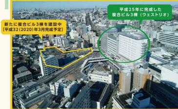
新たに複合ビル3棟を建設中 【平成32（2020）年3期完成予定】