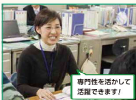
専門性を活かして活躍できます!