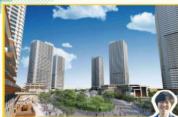
若葉住宅地地区完成予想イメージ