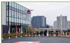
ドローン撮影結果発表