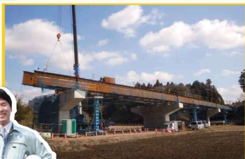
主要地方道 浜野四街道長沼線 (大井戸工区・橋梁架設工事)