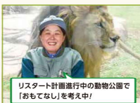
リスタート計画進行中の動物公園で「おもてなし」を考え中!