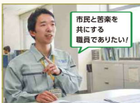
市民と畜舎を繋げる職員でありたい!