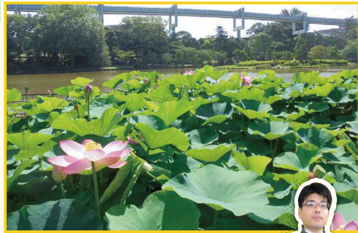
千葉公園のオオガハスと緋打池