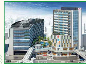
完成イメージパース (左から病院棟、公園棟、商業棟)

千葉都心部では、JR千葉駅の駅舎・駅ビルの建替えや西口・東口地区の再開発事業など、次々と都市機能の刷新が行われています。その中で西口地区の再開発事業は、平成2年に事業計画が決定され、平成25年には複数の飲食店やコンビニエンスストア、ホテル等が入居する3棟の複合ビル「ウェストリオ」を完成させました。現在は新たに3棟のビルを整備しており、健康・福祉をテーマに、商業の他、居住・医療・スポーツクラブなどの多様な用途により、西口地区の更なる賑わいを目指しています。