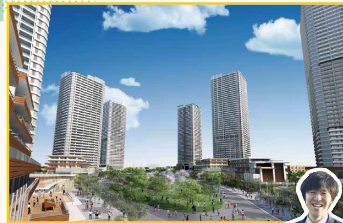
若葉住宅地区完成予想イメージ