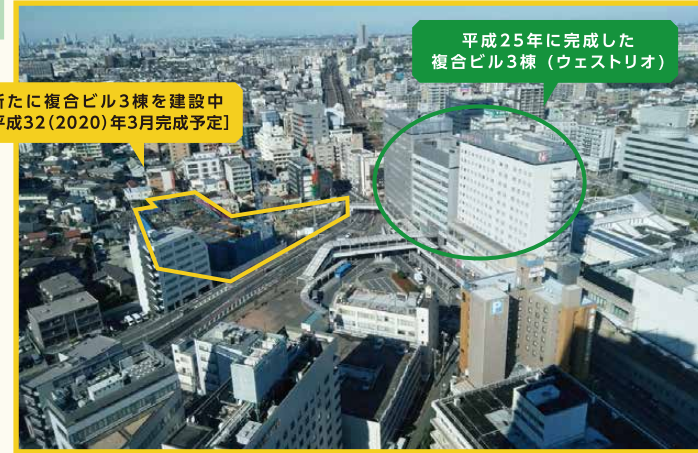
新たに複合ビル3棟を建設中 [平成32(2020)年3月完成予定]