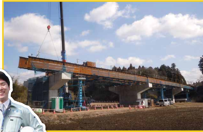
主要地方道 浜野四街道長沼線 (大井戸工区・橋梁架設工事)