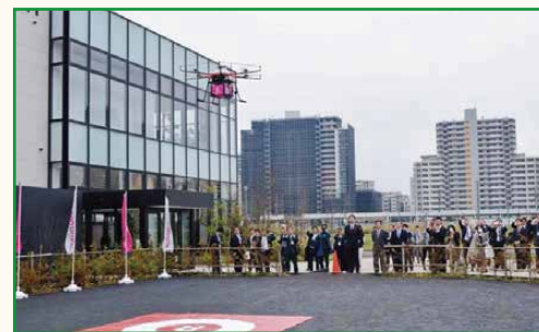
ドローン宅配実証実験