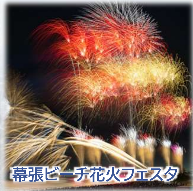
幕張ビーチ花火フェスタ