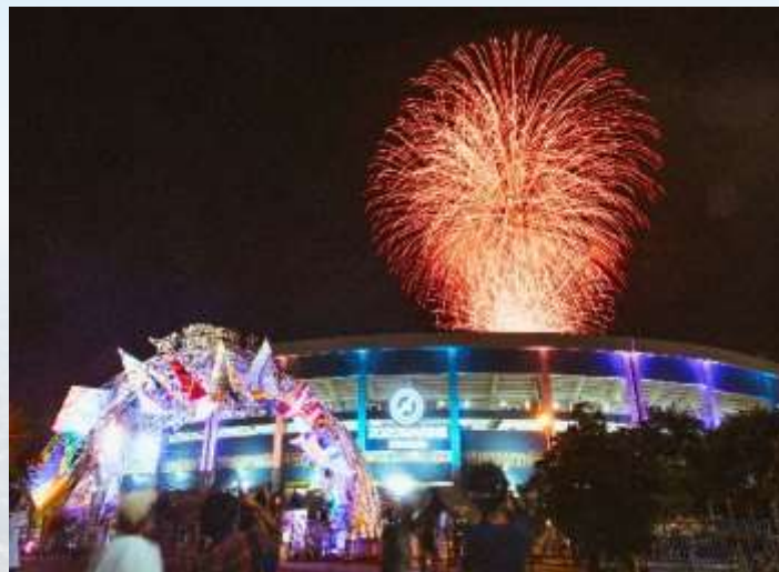
ZOZOマリンスタジアム