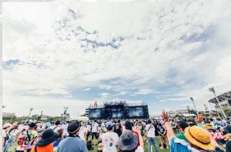
蘇我スポーツ公園