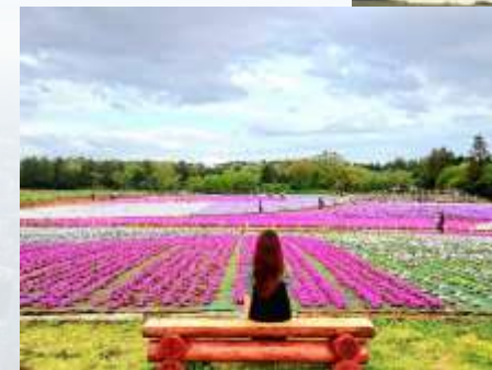
グリーンツーリズム