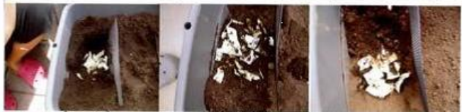
8/14 (黒土) 8/16 (黒土) 8/19 (黒土)