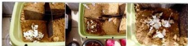
8/14 (庭の土) 8/16 (庭の土) 8/19 (庭の土)