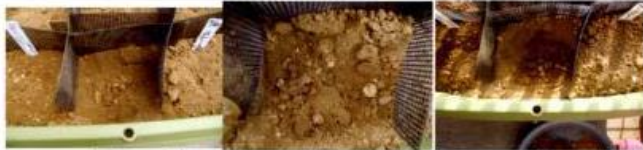
8/14 (庭の土) 8/16 (庭の土) 8/19 (庭の土)