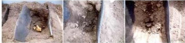
8/14 (黒土) 8/16 (黒土) 8/19 (黒土)