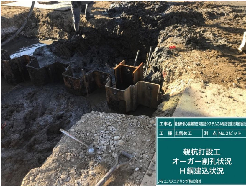
工事名 幕張新都心廃棄物空輸システムごみ輸送管復旧業務委託 工種 土留め工 測点 No.2ピット 親杭打設工 オーガー削孔状況 H鋼建込状況 JFEエンジニアリング株式会社

撮影項目 10 令和3年11月度 履行報告 土留工(立坑構築工) 親杭打設 (工事概要図※2・3) (工程表※2・3)