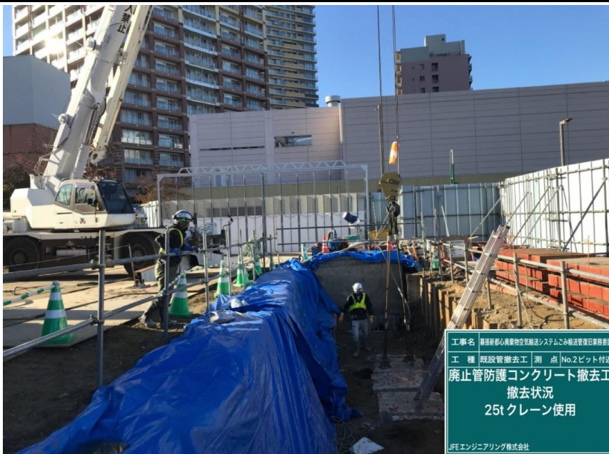
工事名 幕張新都心廃棄物空輸システムごみ輸送管復旧業務委託 工種 既設管撤去工 測点 No.2ピット付近 廃止管防護コンクリート撤去工 撤去状況 25t クレーン使用 JFEエンジニアリング株式会社

撮影項目 10 令和3年11月度 履行報告 土留工(立坑構築工) 親杭打設 (工事概要図※2・3) (工程表※2・3)