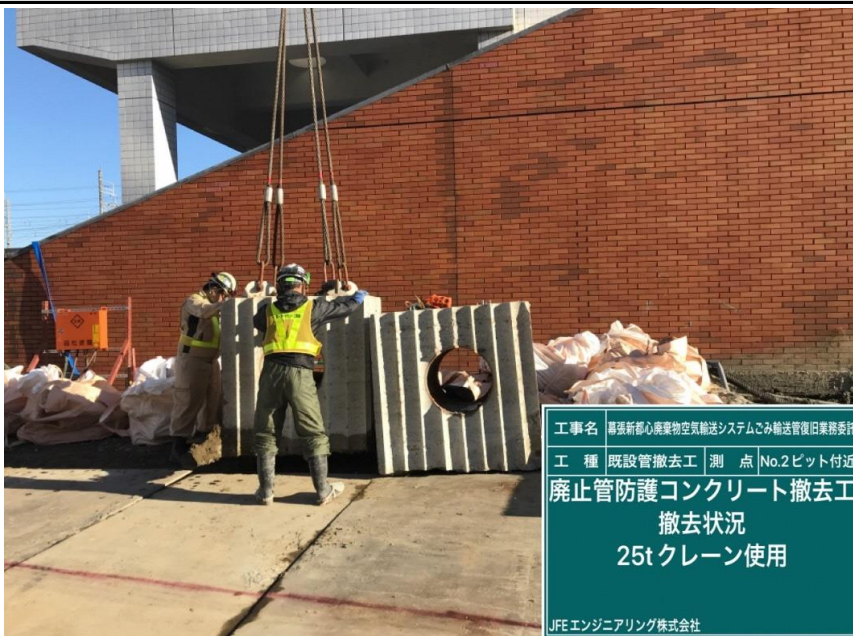
工事名 幕張新都心廃棄物空輸システムごみ輸送管復旧業務委託 工種 既設管撤去工 測点 No.2ピット付近 廃止管防護コンクリート撤去工 撤去状況 25t クレーン使用 JFEエンジニアリング株式会社

撮影項目 11 令和3年11月度 履行報告 土留工(立坑構築工) 廃止管撤去 (工事概要図※4) (工程表※4)