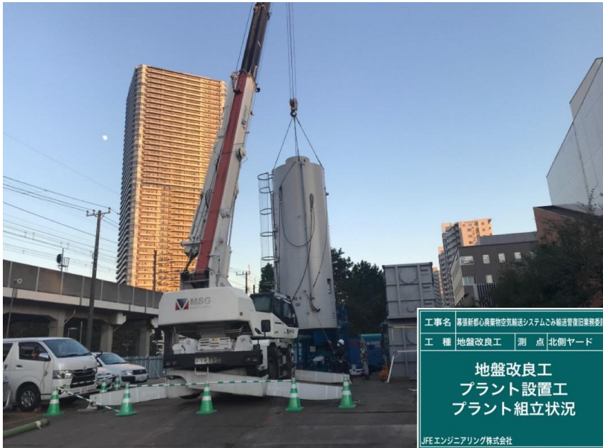
工事名 厚狭新駅心臓部物空輸送システムこみ輸送管復旧業務委託 工種 地盤改良工 測点 北側ヤード 地盤改良工 プラント設置工 プラント組立状況 JFEエンジニアリング株式会社