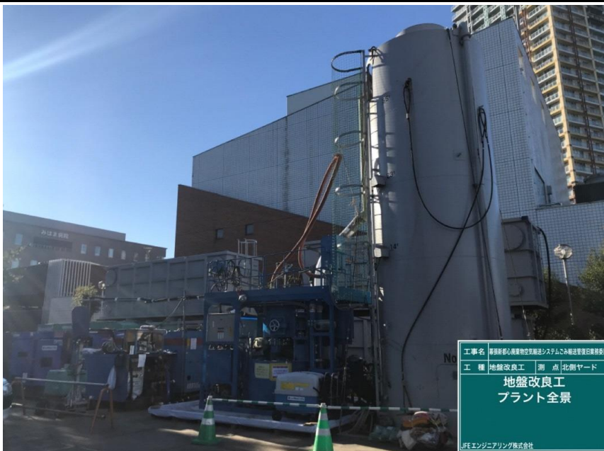
工事名 厚狭新駅心臓部物空輸送システムこみ輸送管復旧業務委託 工種 地盤改良工 測点 北側ヤード 地盤改良工 プラント全景 JFEエンジニアリング株式会社