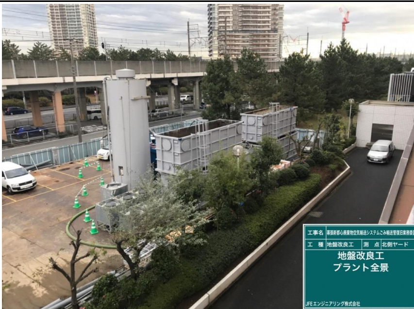
工事名 厚狭新駅心臓部物空輸送システムこみ輸送管復旧業務委託 工種 地盤改良工 測点 北側ヤード 地盤改良工 プラント全景 JFEエンジニアリング株式会社