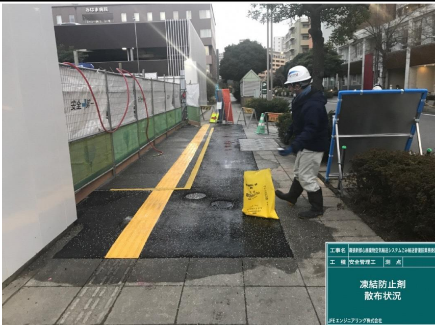
工事名 藤原新幹線高層物空架設システムのみ線法管理員業務委託 工種 安全管理工 測点 凍結防止剤 散布状況 LFEエンジニアリング株式会社