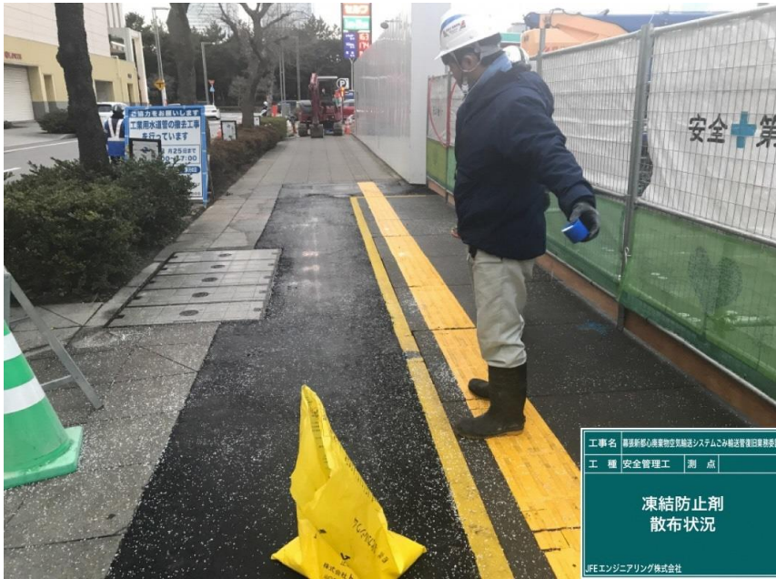
工事名 藤原新幹線高層物空架設システムのみ線法管理員業務委託 工種 安全管理工 測点 凍結防止剤 散布状況 LFEエンジニアリング株式会社