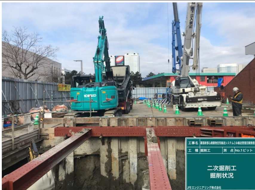
工事名 横浜新都市商業地空輸送システムこみ輸送管理旧業務委託 工種 掘削工 測点 No.1ピット 二次掘削工 掘削状況 JFEエンジニアリング株式会社

撮影項目 5 令和4年2月度 履行報告 掘削工(立坑構築工) No.1ピット 施工全景 (工事概要図※4) (工程表※3)