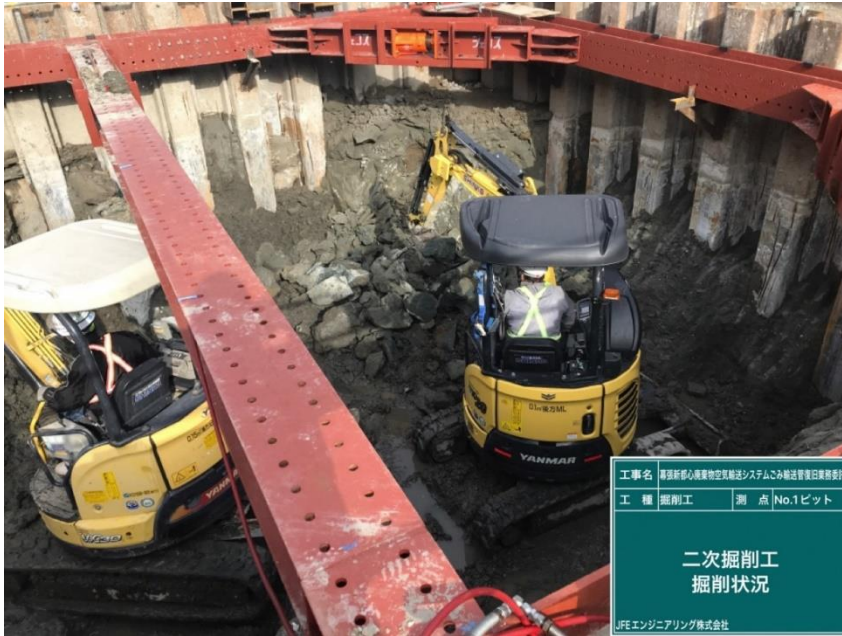
工事名 藤原新駅心臓部物空架設システムこみ輸送管架設工事 工種 掘削工 測点 No.1ピット 二次掘削工 掘削状況 JFEエンジニアリング株式会社

撮影項目 7 令和4年2月度 履行報告 掘削工(立坑構築工) No.1ピット 地盤改良材 取壊し状況 (工事概要図※4) (工程表※3)