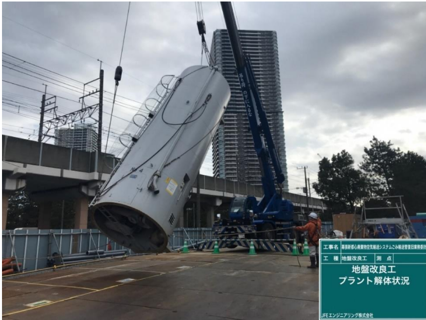
工事名 横浜新都市商業地空輸送システムこみ輸送管理旧業務委託 工種 地盤改良工 測点 地盤改良工 プラント解体状況 JFEエンジニアリング株式会社

撮影項目 4 令和4年2月度 履行報告 地盤改良工 No.2ピット プラント解体状況 (工事概要図※3) (工程表※2)