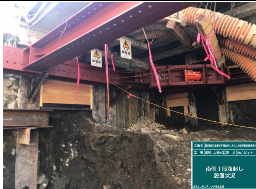
工事名 藤原新駅心臓部物空架設システムこみ輸送管架設工事 工種 掘削、山留め工 測点 No.1ピット 南側1段腹起し 設置状況 JFEエンジニアリング株式会社

撮影項目 7 令和4年2月度 履行報告 掘削工(立坑構築工) No.1ピット 地盤改良材 取壊し状況 (工事概要図※4) (工程表※3)