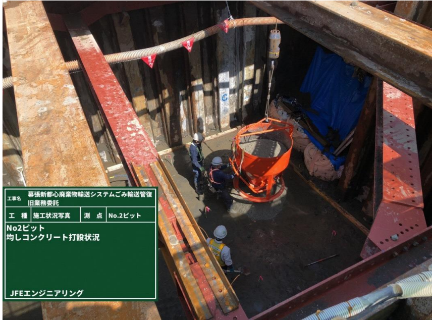
工事名 専強新都心廃棄物輸送システムごみ輸送管復旧業務委託 工種 施工状況写真 測点 No.2ピット No2ピット 均しコンクリート打設状況 JFEエンジニアリング

撮影項目 10 令和4年4月度 履行報告 掘削工(立坑構築工) No.2ピット 掘削工 均しコンクリート打設状況 (工事概要図※2) (工程表※2)