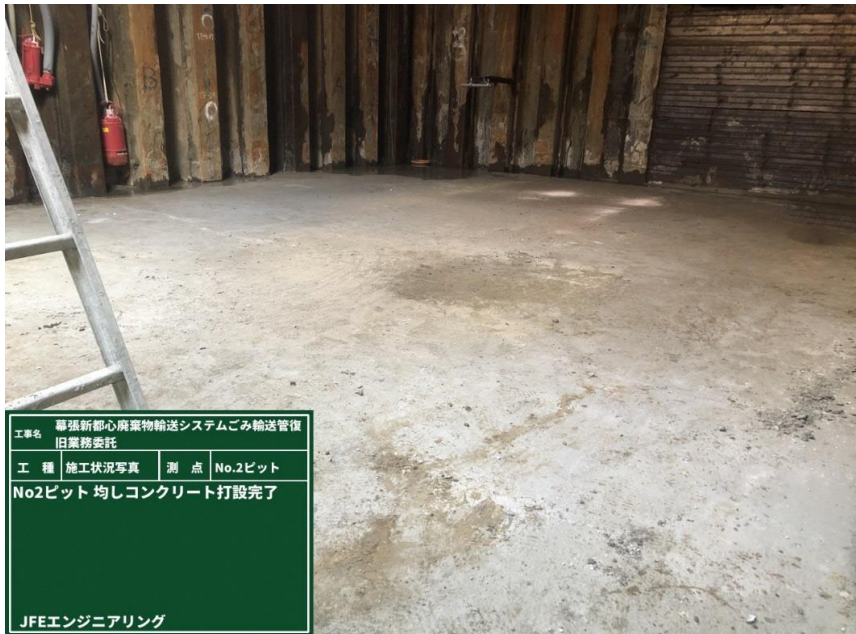
工事名 専強新都心廃棄物輸送システムごみ輸送管復旧業務委託 工種 施工状況写真 測点 No.2ピット No2ピット 均しコンクリート打設完了 JFEエンジニアリング

撮影項目 10 令和4年4月度 履行報告 掘削工(立坑構築工) No.2ピット 掘削工 均しコンクリート打設状況 (工事概要図※2) (工程表※2)