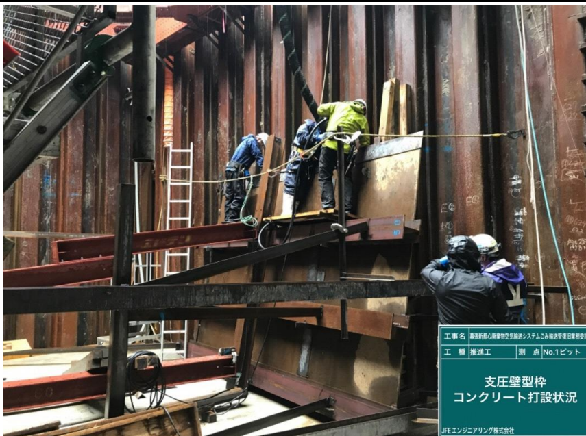
工事名 幕張新都心廃棄物輸送システムごみ輸送管復旧業務委託 工種 推進工 測点 No.1ピット 支圧壁型枠 コンクリート打設状況 JFEエンジニアリング株式会社

撮影項目 4 令和4年5月度 履行報告 掘削工(立坑構築工) No.1ピット 止水対策工 防音措置状況 (工事概略図※1) (工程表※1)