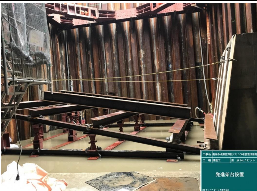
工事名 幕張新都心廃棄物輸送システムごみ輸送管復旧業務委託 工種 推進工 測点 No.1ピット 発進架台設置 JFEエンジニアリング株式会社

撮影項目 5 令和4年5月度 履行報告 躯体工(推進工) 機材搬入・準備工 支圧壁型枠 コンクリート打設 (工事概略図※1) (工程表※2)