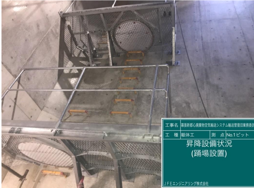
工事名 再張新都心廃棄物空気輸送システム輸送管復旧業務委託 工種 躯体工 測点 No.1ピット 昇降設備状況 (踊場設置) JFEエンジニアリング株式会社