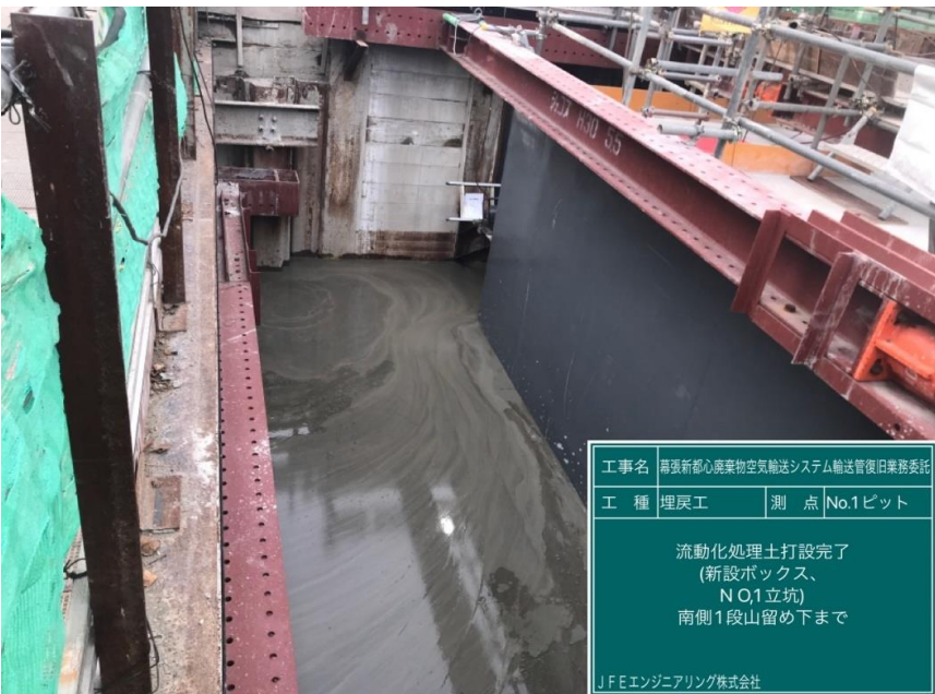
工事名 南張新都心廃棄物空気輸送システム輸送管復旧業務委託 工種 埋戻工 測点 No.1ピット 流動化処理土打設完了 (新設ボックス、 N O,1立坑) 南側1段山留め下まで JFEエンジニアリング株式会社

撮影項目 3 令和4年11月度 履行報告 躯体工 No.1ピット 流動化処理土埋戻状況