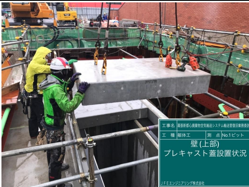
工事名 再張新都心廃棄物空気輸送システム輸送管復旧業務委託 工種 躯体工 測点 No.1ピット 壁(上部) プレキャスト蓋設置状況 JFEエンジニアリング株式会社