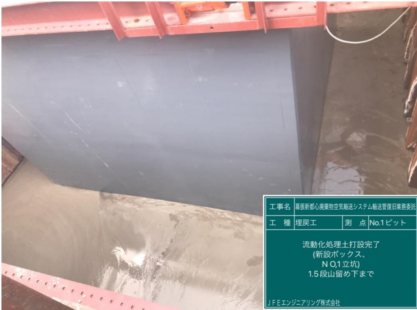
工事名 南張新都心廃棄物空気輸送システム輸送管復旧業務委託 工種 埋戻工 測点 No.1ピット 流動化処理土打設完了 (新設ボックス、 N O,1立坑) 1.5段山留め下まで JFEエンジニアリング株式会社

撮影項目 2 令和4年11月度 履行報告 躯体工 No.1ピット 流動化処理土埋戻状況