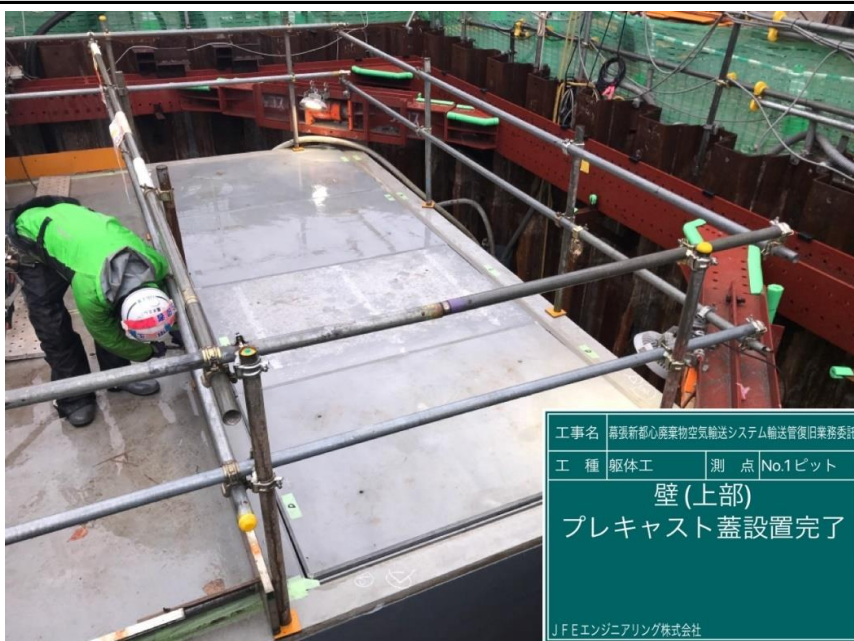
工事名 再張新都心廃棄物空気輸送システム輸送管復旧業務委託 工種 躯体工 測点 No.1ピット 壁(上部) プレキャスト蓋設置完了 JFEエンジニアリング株式会社