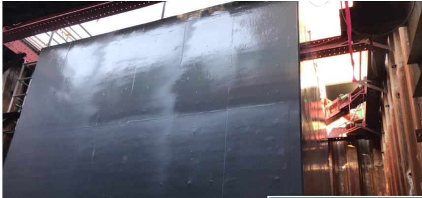
工事名 南張新都心廃棄物空気輸送システム輸送管復旧業務委託 工種 躯体工 測点 No.1ピット 壁(上部) 防水処理完了状況 JFEエンジニアリング株式会社