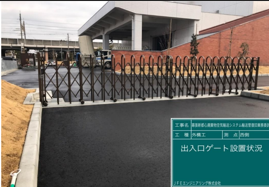
工事名 幕張新都心廃棄物空気輸送システム輸送管復旧業務委託 工種 外構工 測点 西側 出入口ゲート設置状況 JFEエンジニアリング株式会社