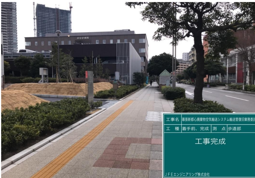
工事名 幕張新都心廃棄物空気輸送システム輸送管復旧業務委託 工種 着手前、完成 測点 歩道部 工事完成 JFEエンジニアリング株式会社