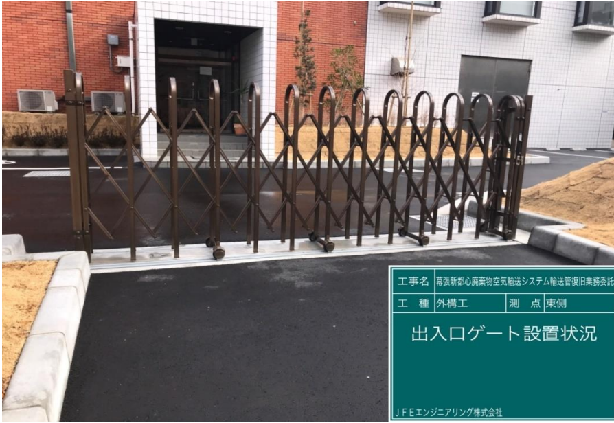
工事名 幕張新都心廃棄物空気輸送システム輸送管復旧業務委託 工種 外構工 測点 東側 出入口ゲート設置状況 JFEエンジニアリング株式会社