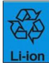
リチウム イオン電池