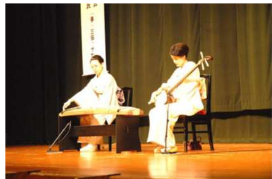
イベントの様子 (第2部コンサート)