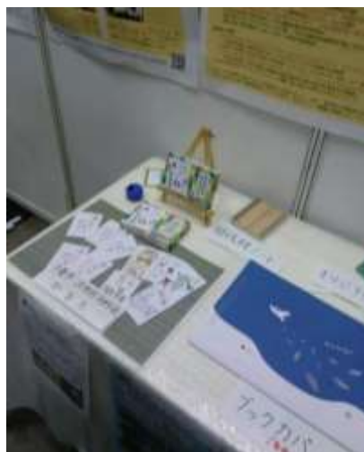
イベントでの展示の様子