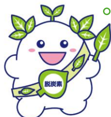
千葉市脱炭素キャラクター エコ葉