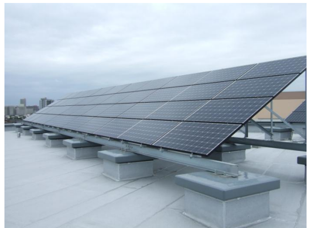
学校の屋上への設置状況（緑町小学校）