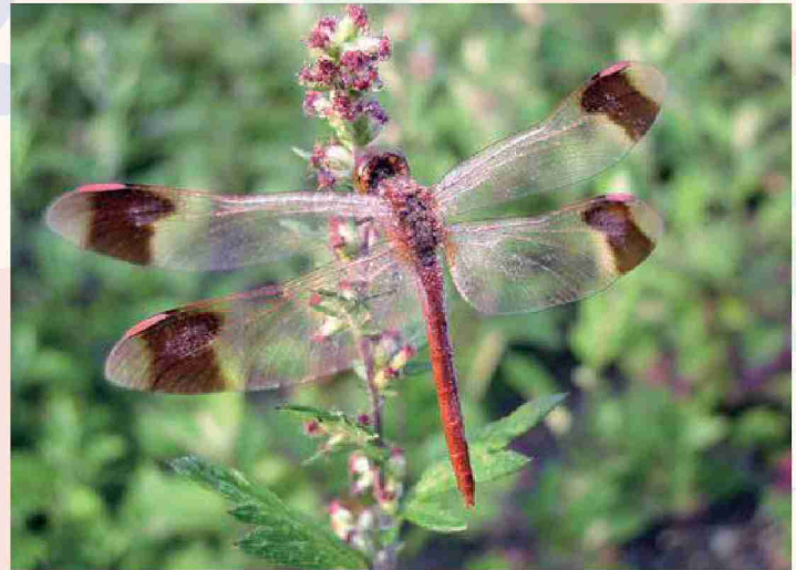
ミヤマアカネ (背面から翅の模様を撮影)