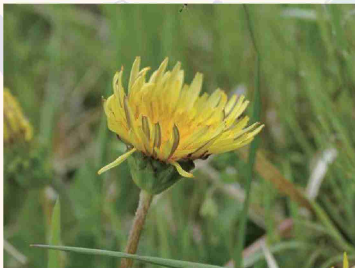
花などの特徴がわかる写真