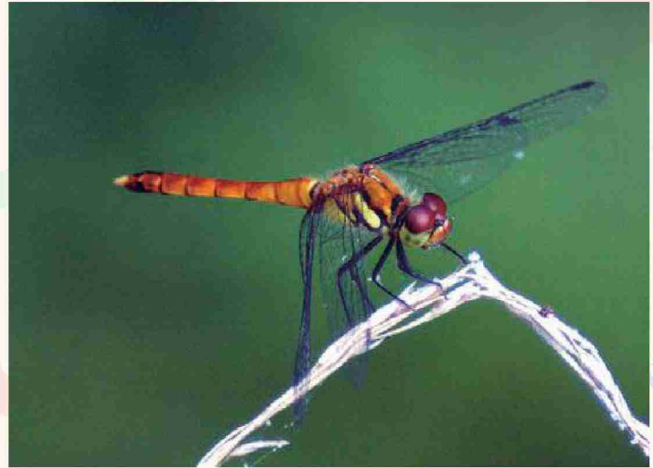
ナツアカネ (横から胸の模様を撮影)