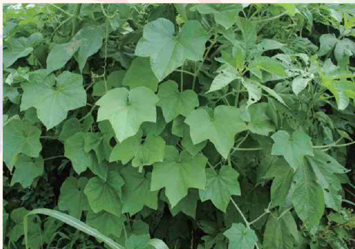
全体がわかる写真