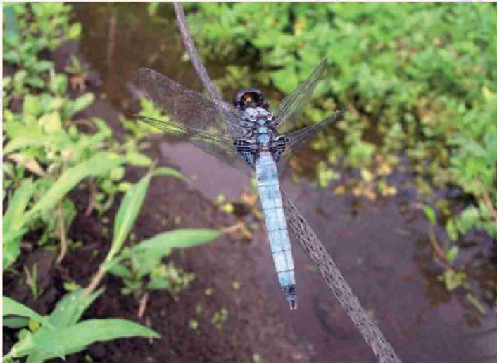
オオシオカラトンボ (背面から翅の模様を撮影)