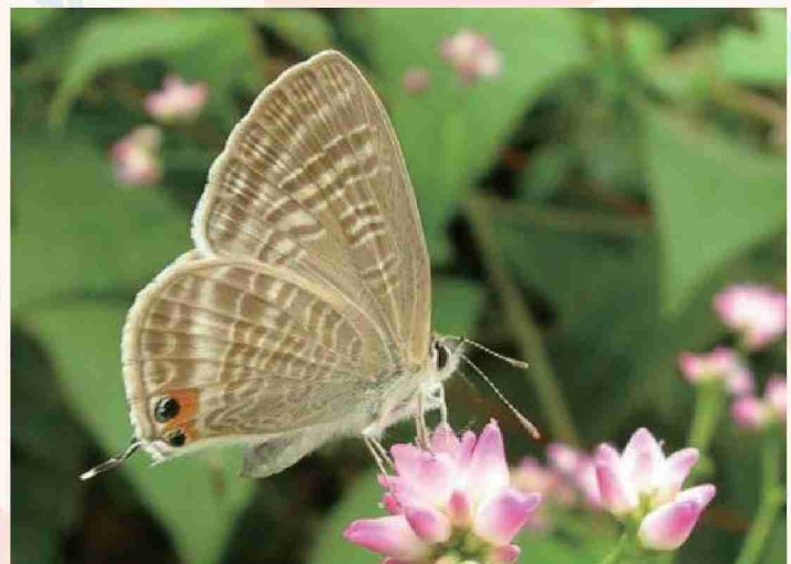
ウラナミシジミ (横から翅の模様を撮影)