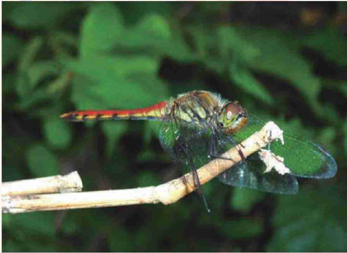
アキアカネ (横から胸の模様を撮影)

トンボのなかまは、胸の模様や翅の模様で種を見分けることができます。背面、または横から胸の模様がわかる写真を撮影してください。