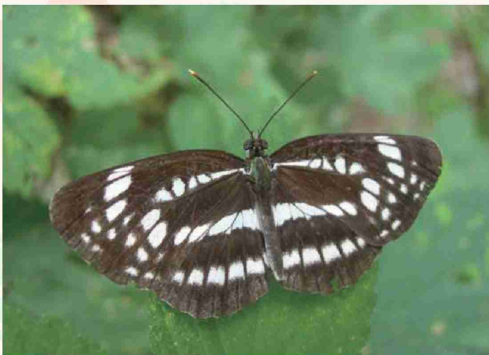
ホシミスジ (背面から翅の模様を撮影)

チョウのなかまは、翅の模様で種を見分けることができます。翅を開いて止まっているものは背面から、翅を閉じて止まっているものは横から、翅の模様がわかるように撮影してください。