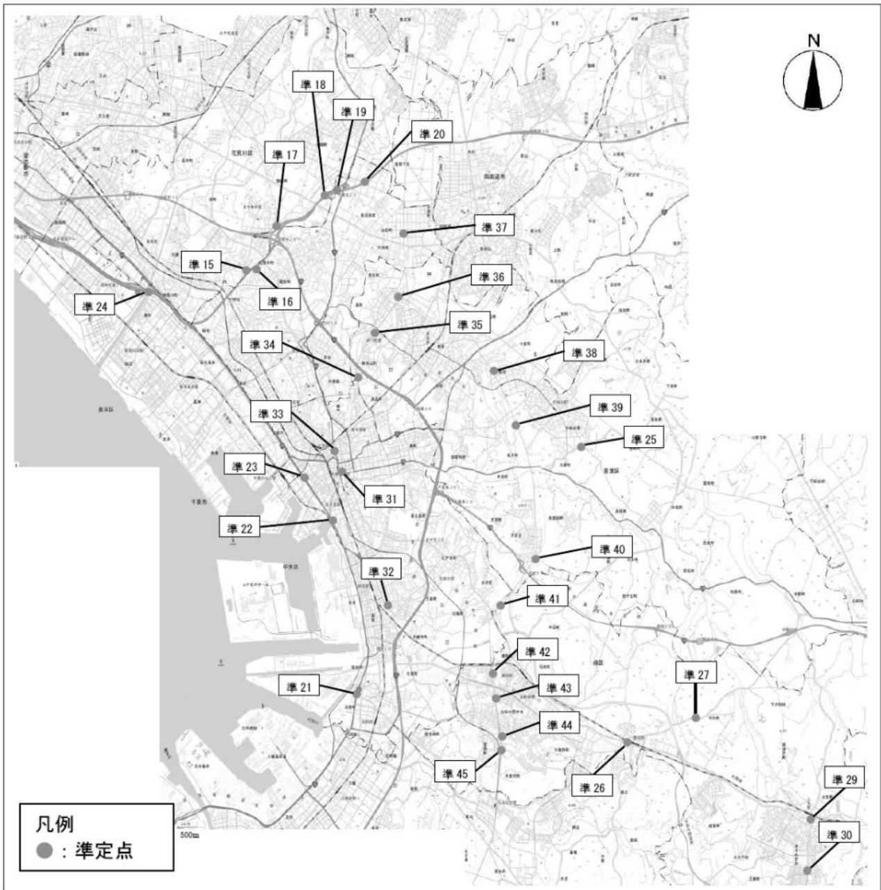
図2 自動車騒音常時監視 準定点調査地点（令和3年度）