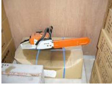
チェーンソーの油漏れ