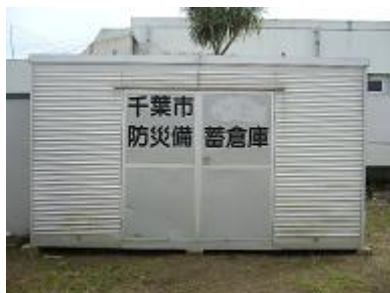
備蓄倉庫（コンテナ）

市地域防災計画では、これら備蓄倉庫に、避難所における被災者の一時的生活のために必要な食糧、毛布・寝具等の生活必需品、初期消火活動その他の応急復旧対策に必要な資機材等の分散備蓄を進め、コミュニティ拠点（市内各中学校区）を単位とする災害発生初期の円滑な救援救護活動に期することとしている。