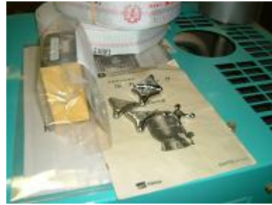
蛇口のハンドルを設備内で保管