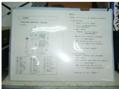
使用マニュアル（防災無線）