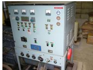
耐震性井戸付貯水槽設備内