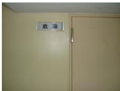
名称が不明瞭なもの

場所の掲示は、備蓄倉庫の場所を把握する重要なものであることから、明確な室名表示を掲示するようにされたい。