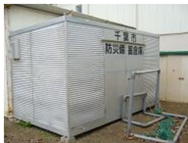
体育器材が置かれている