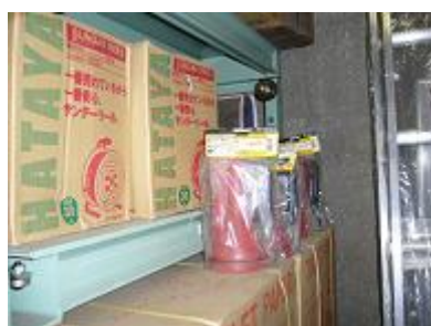
強力ライト・コードリール