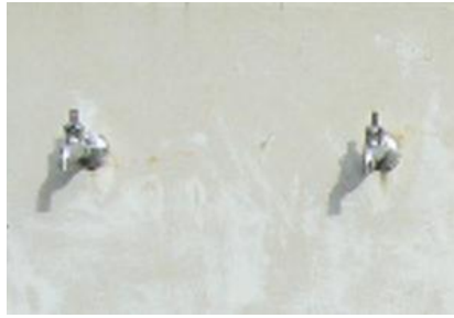
蛇口のハンドルがなくなっている