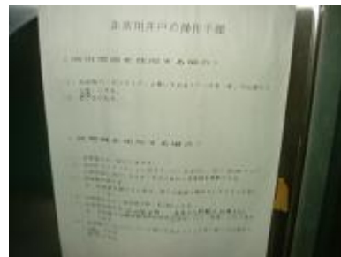
使用マニュアル（非常用井戸）