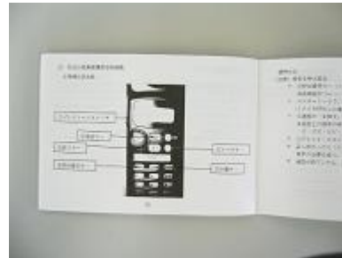
ポケット版記載の使用方法（防災無線）