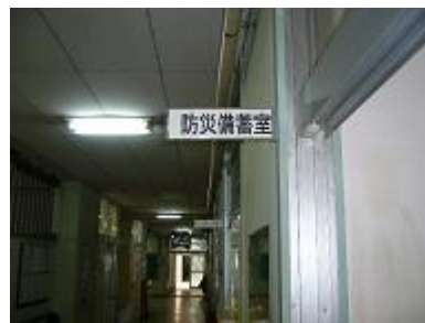
備蓄倉庫（余裕教室）

また、当該計画では、災害時の飲料水・生活用水を確保するため、備蓄倉庫を設置した小学校に併せて非常用井戸も整備しており、生命維持の上から最低限必要な量として、飲料水では1人1日3リットル、生活用水では1人1日16リットル、合計1人1日19リットルの水を確保することとしている。