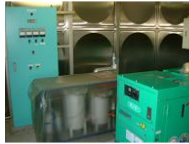
非常用井戸設備内（主電源・発電機）