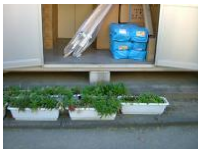
プランターが置かれている

備蓄倉庫の入口にプランターや体育器材が置かれている箇所が見受けられたが、それらは、防災備蓄品を搬出する際の障害となりうるので、適切に管理されたい。