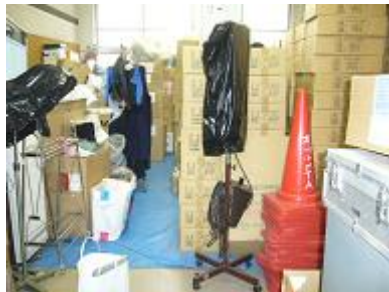
整理整頓が行われていない

については、定期的な整理整頓や配置図の備え付け、または防災備蓄品が収められた段ボール箱への品名の記載など、災害時に迅速な対応ができるよう適切に管理されたい。