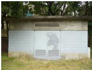
耐震性井戸付貯水槽

広域避難場所 大地震等による広域災害などから身の安全を守るための場所で、相当程度のオープンスペースが確保された公園等のことをいう。