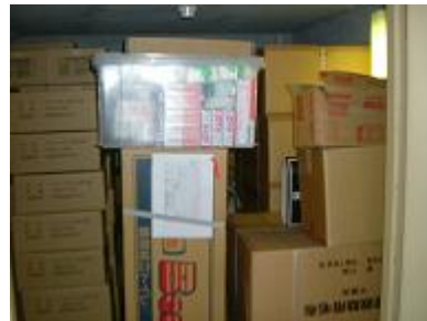
大量に備蓄品が積まれている