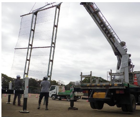
写真 つり荷に手を触れている例

クレーンの作動中に作業員がつり荷に触れる行為は、作業員の衝突やはさまれ事故に繋がる危険性があるため、介錯ロープなどを用いる安全な方法により施工するよう、受注者に対して指導されたい。